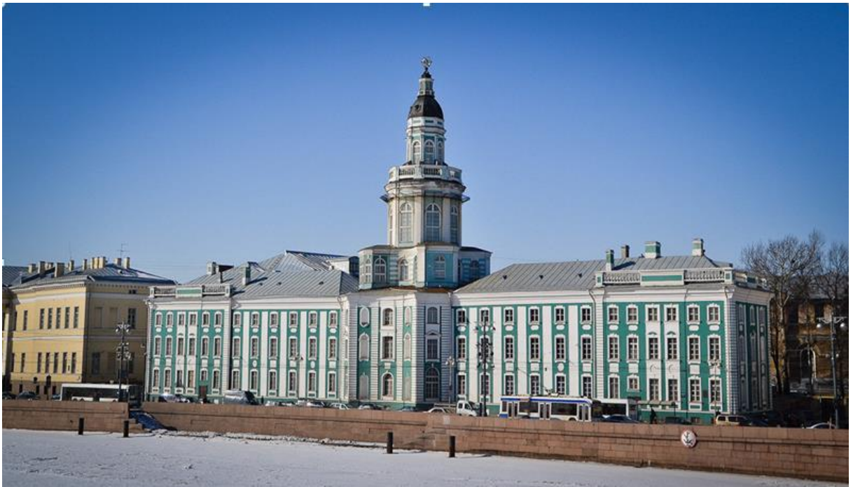
Кунсткамера. Музей антропологии и этнографии им. Петра Великого