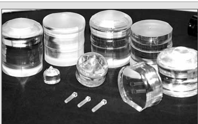
Монокристаллы ниобата и танталата лития, выращенные в Лаборатории материалов электронной техники