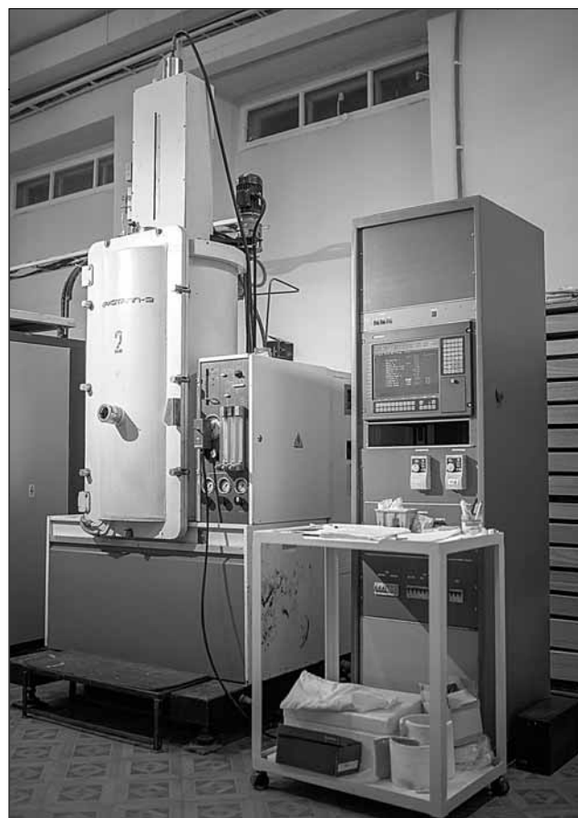
Установка «Кристалл-2» для выращивания монокристаллов методом Чохральского